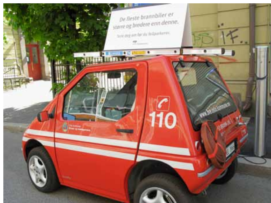
"Brannbilen" var et populært innslag i bybildet og trafikkbetjentene fikk god kontakt med publikum.