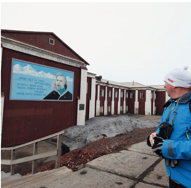
Søndag var det fridag og styret valgte da å tilbringe dagen på båten Polar Girl. Turen gikk til den Russiske byen Barentsburg. Nyttig og lærerik opplevelse.

–Grunnen er at de som planlegger ofte glemmer «oss» og vi blir avspist med dårlige løsninger. Vi vil komme med en veileder med anbefalinger for planleggere og beslutningstagere. Vi vurderer også kurs for planleggere og beslutningstagere, men har ikke helt funnet formen her ennå, sier han. Disse tingene er viktig for arbeidsmiljøet, for disse yrkesgruppene. Standard må inneholde både dagens og framtidens krav, mener Berg.