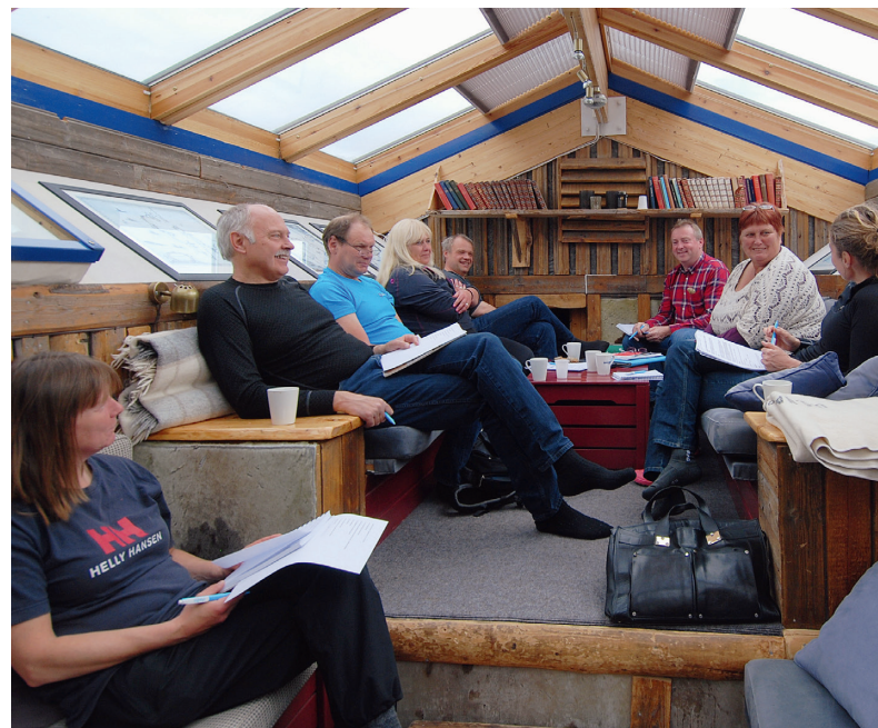
Styret samlet på Basecamp Spitsbergen for å drøfte fag, framtid og utfordringer. Et vellykket og viktig møte som har gitt ny inspirasjon til den viktige jobben som skal gjøres i organisasjonen framover.